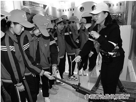
参观青沧战役展览馆