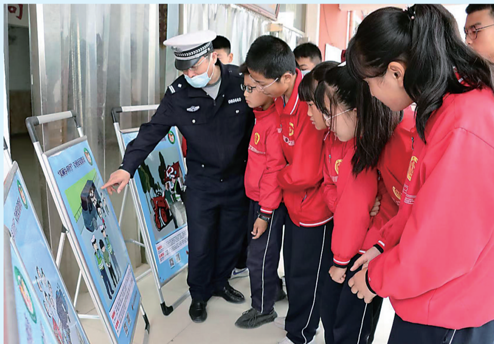
近日,盐山交警大队民警来到盐山职教中心,为学生们讲解交通事故案例,提醒学生遵守交通法规,文明出行。

渤海新区黄骅市公安局特巡警大队联合群东街道交通社区新时代文明实践站走进黄骅市第一幼儿园,开展“知安全 会避险 安全成长”防拐骗宣传课,为小朋友们上了一堂生动有趣的防拐骗宣传课。