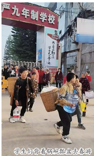
学生们背着锅碗瓢盆去春游

视频中,学生们背着背篓、提着袋子陆续走出学校,脸上洋溢着笑容。他们的背篓中,或装着锅碗瓢盆,或装着柴火、蔬菜