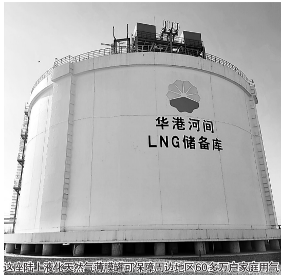
这座陆上液化天然气薄膜罐可保障周边地区60多万户家庭用气

“海上用薄膜型液化天然气船存储、运输液化天然气,陆地一般用的是传统的9%镍钢罐存储液化天然气。”“华北油田”华港燃气公司河间液化天然气储备库肩负着保障周边地区用户用气的责任。在港口存储液化天然气,再铺设管道运输的话,成本太高。于是,这座陆上液化天然气薄膜罐便应运而生。“华北油田”华港燃气公司河间液化天然气储备库项