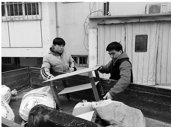
近日,新华区祁孟庄社区组织党员志愿者在多个小区开展“清洁行动”。活动中,大家清走小区内乱堆乱放的杂物和垃圾10余车。

何伟提醒市民,鼻腔存异物多见于儿童。鼻塞、鼻腔异味,且炎症长期不愈都有可能引起头疼。市民一旦出现头疼且鼻腔内长时间流脓鼻涕等情况,要尽快就医。