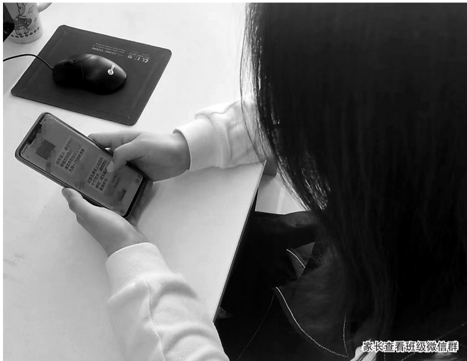
家长查看班级微信群

发现,群里的家长都是复制粘贴的“谢意”,且只要老师留言,下面都会跟一大串类似的话。