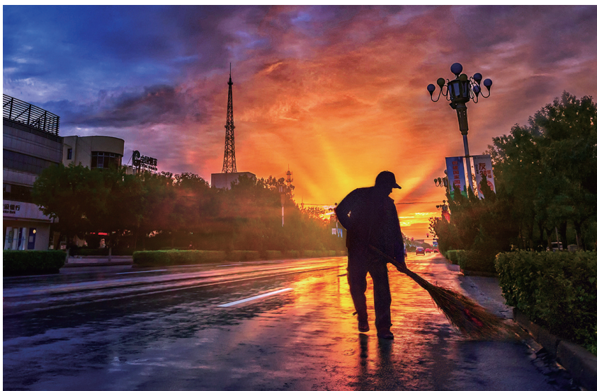
《城市之光》

在居住的城市和生长的村庄，那些数不清的美好画面，让身在其中、参与勾画画面的人，无论多少次在画里走过，都是那么亲切与温暖，无论多少次向别人展示与诉说，都是那么自豪与幸福。