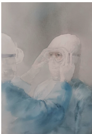
《整装待发》(美术 葛静)