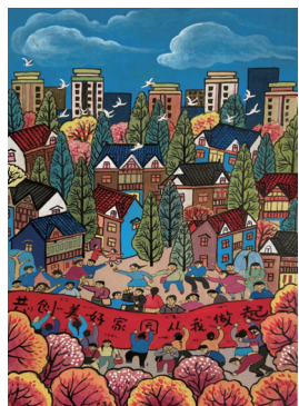
《共创美好家园从我做起》 (美术 尹萍)