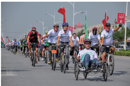
《绿色出行》