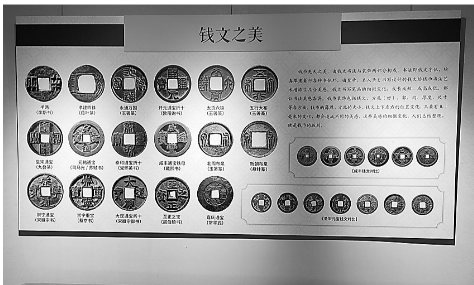
此次展览详细介绍了各种古钱币。

古钱币开展展后,吸引了很多居民前来参观。“古钱币先进的制作技艺,让我由衷钦佩先人们的智慧。”市民张先生说,通过这次展览,他还进一步了解了渤海新区、黄骅在历史上的兴衰。