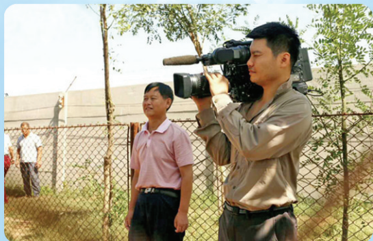
▲ 央视农民频道《每日农经》栏目摄制组在农场养殖基地现场录制节目

无激素、无抗生素、无转基因、无反式脂肪酸、无药物残留。 高蛋白、低脂肪、低胆固醇、富含钾镁铁及18种氨基酸。 要想人健康，先让猪健康。