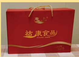
中国好猪肉各种精品礼盒