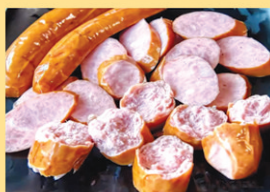
欣天蓬黑猪肉儿童香肠

《绿色食品 畜肉》，包括马牛羊猪驴兔子等所有家畜，但到目前为止，用此标准检验，以此标准卖肉的仅此一家。