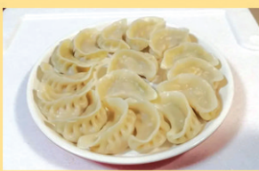
黑猪肉手工水饺(蒸熟更好吃)