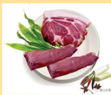
健康黑猪肉，梅花小里脊。