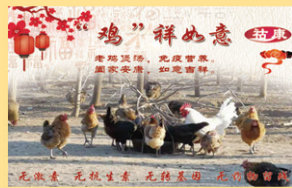
雌雄相伴，自主产蛋。受精卵，健康蛋。常吃营养体康健。