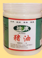
板油熬制的一级黑猪油