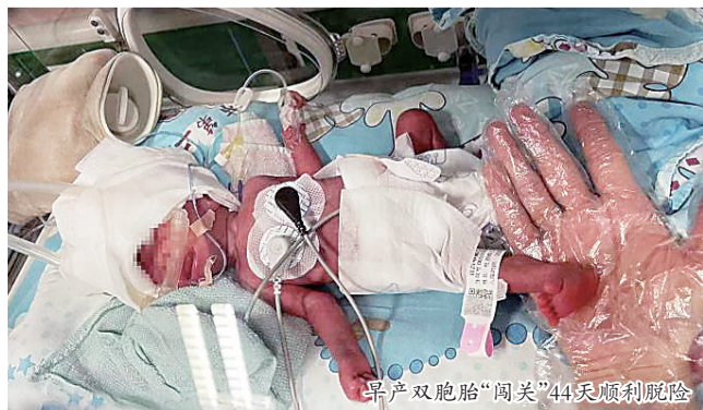
早产双胞胎“闯关”44 天顺利脱险

一对出生体重均不到两公斤的早产双胞胎, 出生后出现窒息、呼吸衰竭等严重疾病。记者 13 日从湖北省宜昌市第二人民医院获悉, 该院 NICU 医护人员经过 44 天的“战斗”, 帮助双胞胎早产儿闯过重重难关, 顺利出院。