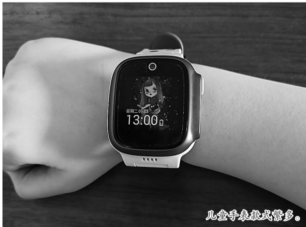
儿童手表款式繁多。

系。只要完成各种任务,就可以获得积分。这一套积分体系,是精心设计的,很容易让孩子着迷。