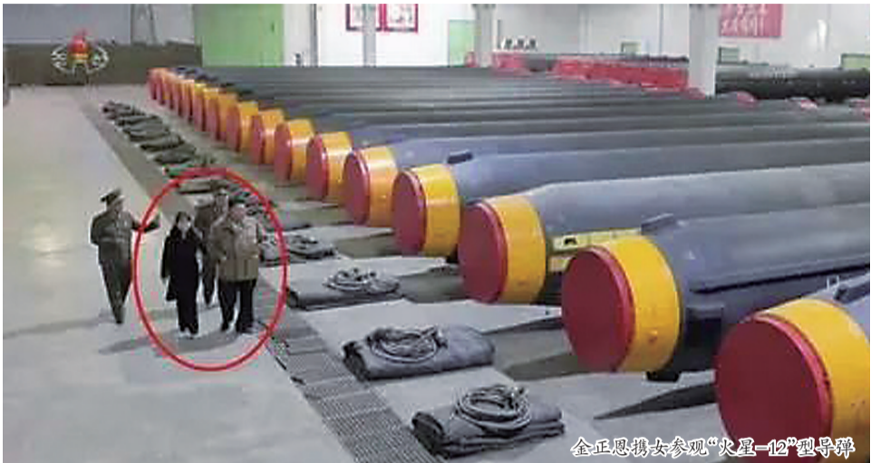
金正恩携女参观“火星-12”型导弹

据新华社援引朝中社1日报道,朝鲜人民军西部地区某远程炮兵部队当天凌晨使用超大型火箭炮向朝鲜半岛东部海域发射了一枚炮弹。