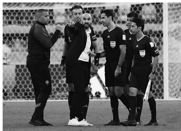
摩洛哥主帅与裁判交流