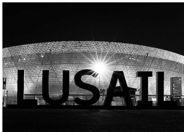
卢赛尔体育场，中国制造。