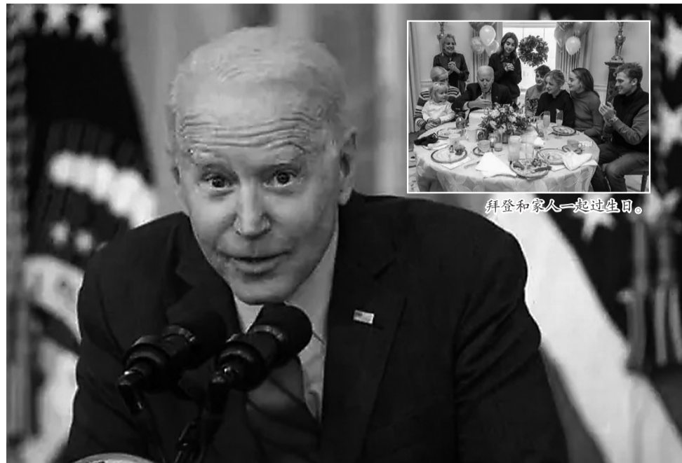
拜登和家人一起过生日。

近日，美国总统拜登低调度过了80岁生日。这是首次有美国在任总统迎来80岁生日，拜登和家人在白宫举行了聚会。