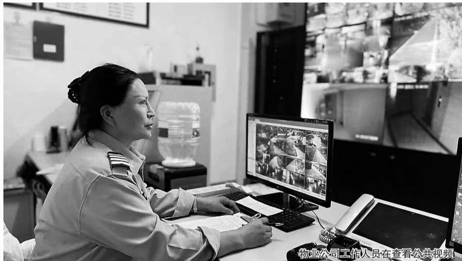
物业公司工作人员在查看公共视频