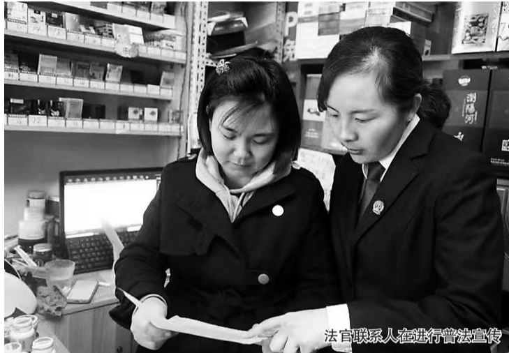
法官联系人在进行普法宣传

据悉,“家事纠纷调解室”由盐山县人民法院和盐山县妇联联合成立,是针对大型社区设立的专门调解组织,着力保障妇女儿童合法权益,帮助群众将纠纷化解在家门口,