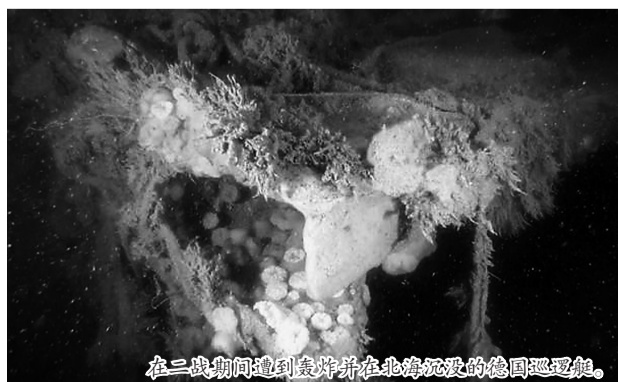
在二战期间遭到轰炸并在北海沉没的德国巡逻艇。