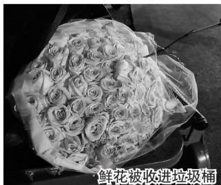
鲜花被收进垃圾桶

男朋友送的鲜花扔在楼道的地上,并且和对门邻居的垃圾袋放在一起,清洁工按照普通人的正常判断:该鲜花属于废弃物,属于正常认知。清洁工将其与垃圾一起清理,没有违反物业合同的义务,也不存在侵权行为,并无任何过错。清洁工不用赔偿。