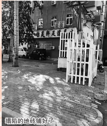
塌陷的地砖铺好了

【办好了】 市区黄河西路“尚客优精选酒店”西侧,便道上塌陷的地砖已重新铺设,地面已恢复平整。