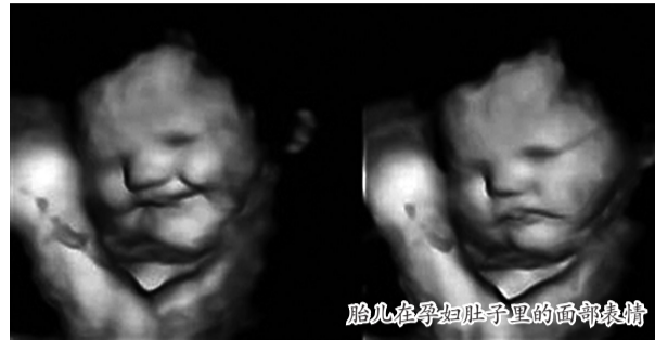
胎儿在孕妈妈肚子里的面部表情

英国杜伦大学牵头的一项研究显示,胎儿对母亲吃下的不同味道食物反应各异。研究人员由此认为,孕妇饮食可能会影响宝宝出生后的口味偏好,如适当引导,或许能帮助宝宝养成健康饮食习惯。