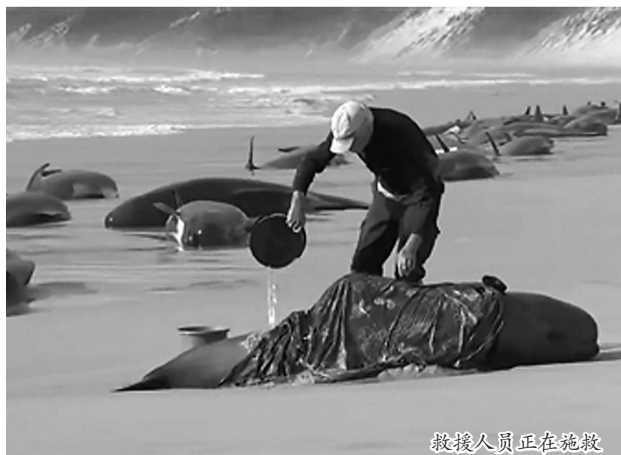
救援人员正在施救

据新华社电 澳大利亚塔斯马尼亚州野生动物管理部门22日确认,前一天被发现搁浅于塔斯马尼亚岛西海岸的230头领航鲸中,仅35头存活。