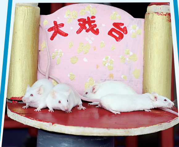
戏台上的“小演员”们