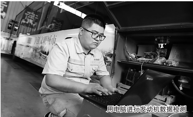
用电脑进行发动机数据检测