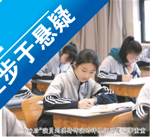
“00后”演员刘琪琪饰演的许恩怀总是心事重重