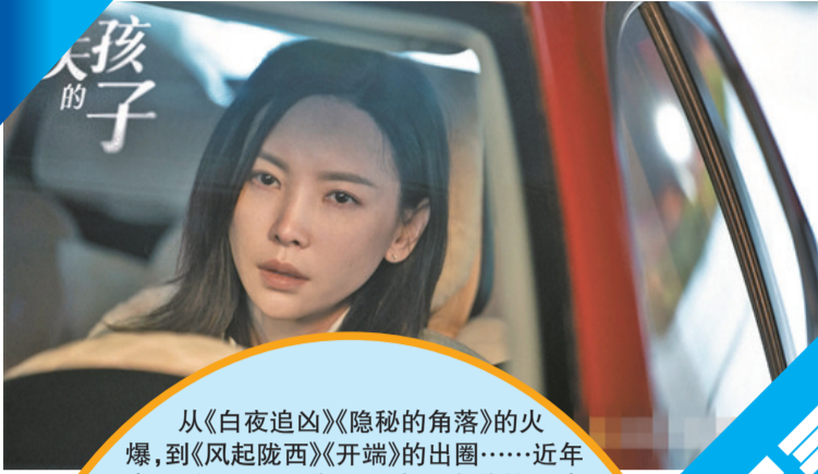
于文文饰演表面柔弱内心强大的林楚萍(左图)