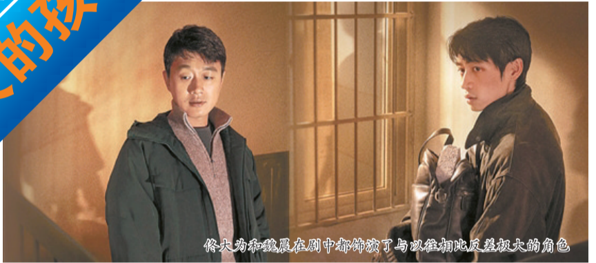
佟大为和魏晨在剧中都饰演了与以往相比反差极大的角色