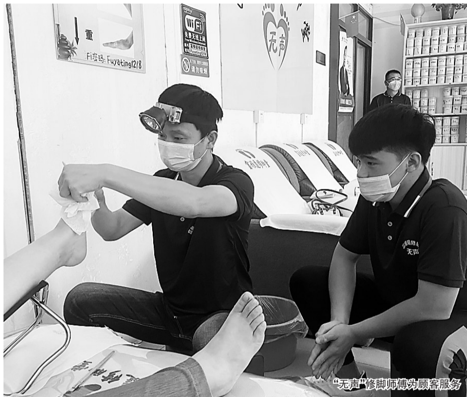
“无声”修脚师傅为顾客服务