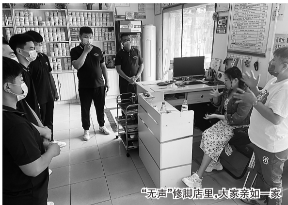
“无声”修脚店里,大家亲如一家