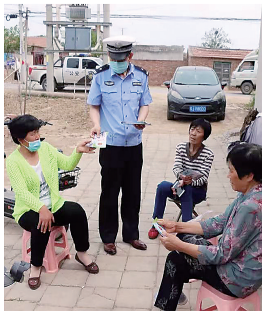
近日,盐山交警大队民警深入乡村向农民发放交通安全提示卡,提醒大家秋收期间注意交通安全。