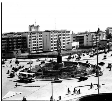
清池大道与解放路交叉口(摄于2000年)