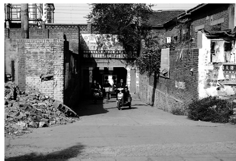
原维明路道洞子(摄于1995年)

城市在变迁,那些普通的街巷、房屋、河流被照片定格。现在的人们可以在城市的变迁中找寻那些珍贵的记忆。