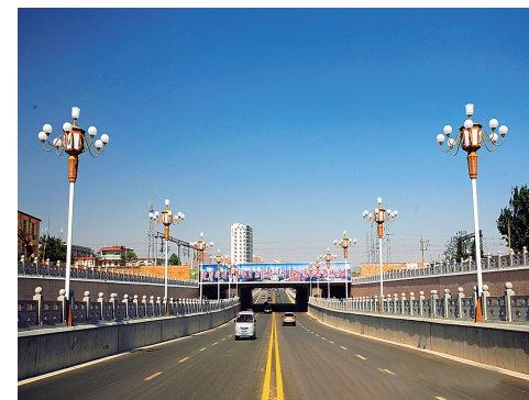
维明路立交桥(摄于2013年)