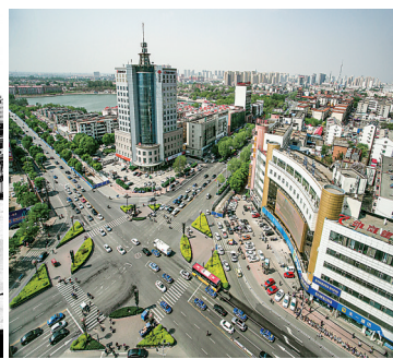
清池大道与解放路交叉口(摄于2020年)