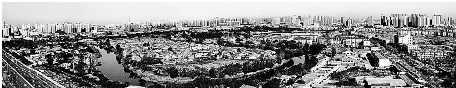
原南关口与张家坟(摄于2017年)