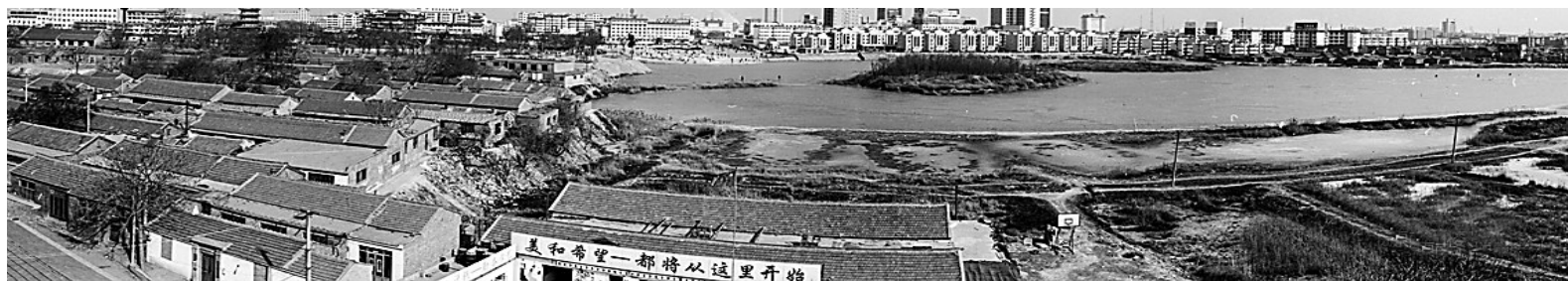
原南川楼与南湖(摄于1995年)