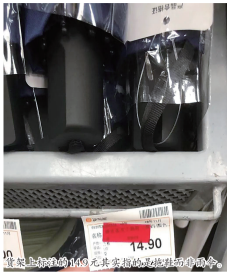
货架上标注的14.9元其实指的是拖鞋而非雨伞。

14.9元的价签。价签的商品名称上贴了一张半透明的红纸，透过红纸仔细辨认，被遮挡的物品名称实际为拖鞋。这个货架上确实有拖鞋，位置在最底层，不蹲下来几乎很难看到。