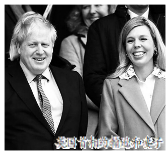
约翰逊夫妇在官邸