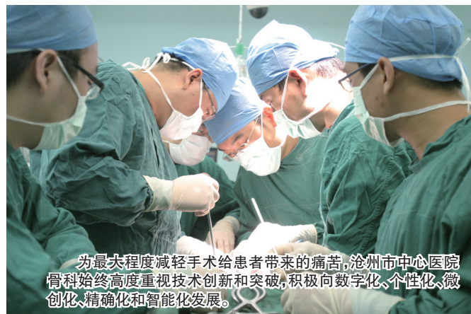
为最大程度减轻手术给患者带来的痛苦,沧州市中心医院骨科始终高度重视技术创新和突破,积极向数字化、个性化、微创化、精准化和智能化发展。

路漫漫其修远。在国际先进理念的推动下,高新技术成为骨科发展的永恒动力。其实,早在20世纪70年代初,沧州市中心医院就