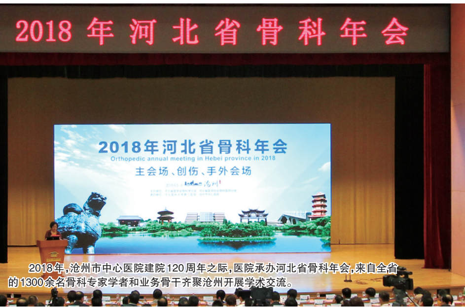
2018年,沧州市中心医院建院120周年之际,医院承办河北省骨科年会,来自全省的1300余名骨科专家学者和业务骨干齐聚沧州开展学术交流。

展的理念。也正是如此,才成就了如今骨科蓬勃发展的态势。如今的骨科,更加专业化、精细化。骨科病区、骨科手术室、外科ICU、电生理室等一应俱全。骨科也由原来的1个科室发展到5个科室。微创手术更成为沧州市中心医院骨科的一个特色名片。