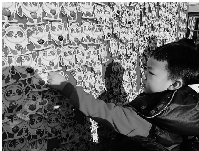
祝愿孩子们在新的一年里生活甜蜜，身体棒棒。

近日，东光县第二幼儿园举行开学礼活动。老师们亲手为每个孩子制作了“冰墩墩”棒棒糖，