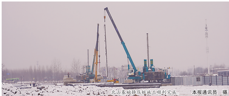
北山基础静压桩施工顺利完成。

为了确保园博会顺利召开,在整个施工过程中,中铁八局一手抓防疫、一手抓施工生产,以工期为主线,精心布置,加班加点,有力地推动了园博园建设的各项工作有序进行。