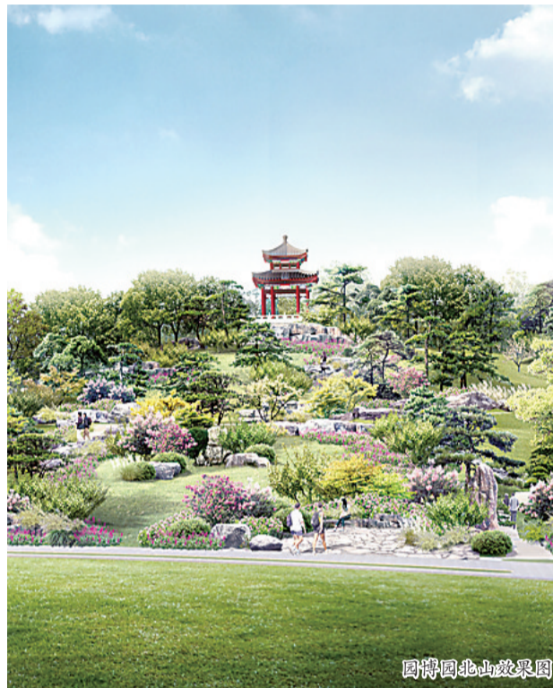
园博园北山效果图