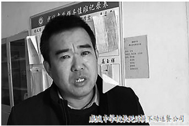
戚城中学食堂工作人员在厨房操作。

给一四川企业经营,双方合作4年有余。今年11月15日,涉事公司北京志宏恒达商贸有限公司封丘分公司开始给戚城中学配送餐。