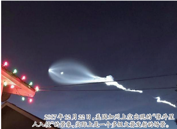
2017 年 12 月 22 日，美国加州上空出现的“像外星人入侵”的景象，实际上是一个多级火箭发射的场景。

“51 区”是美国在冷战时期建立的设施，用作研发和建造新型战机。直到 2013 年，美国中央