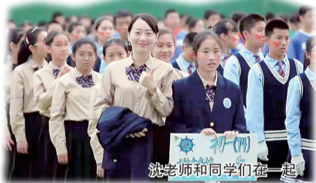
沈老师和同学们在一起