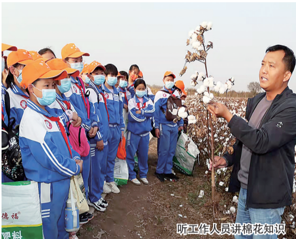
听工作人员讲棉花知识