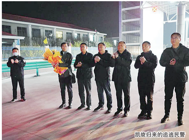
凯旋归来的追逃民警