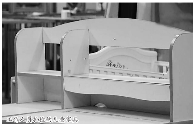
工作人员抽检的儿童家具

用者手指可能造成的危害。尽管国家标准有明确规定,检测过程中仍然有8批次样品孔及间隙项目不合格,整整占了不