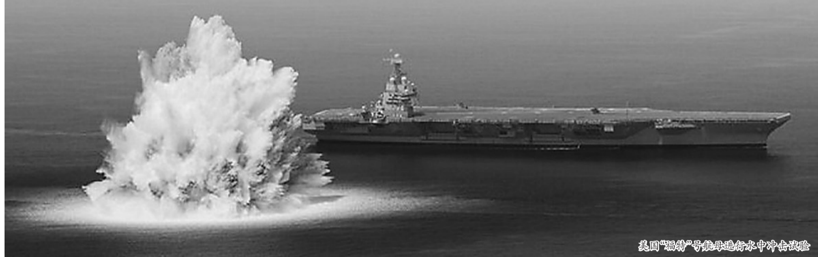
美国“福特”号航母进行水中冲击试验