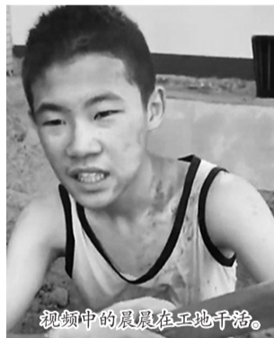
视频中的晨晨在工地干活。