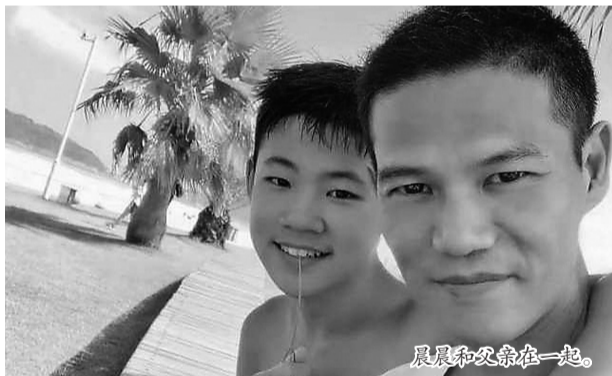
晨晨和父亲在一起。

近日,一段视频突然爆红网络,视频中的男孩喘着粗气,身上粘满泥沙,瘫坐在地上。一名男子问道:“累不累啊?读书好还是干活好?”男孩答道:“读书好,读书好。”