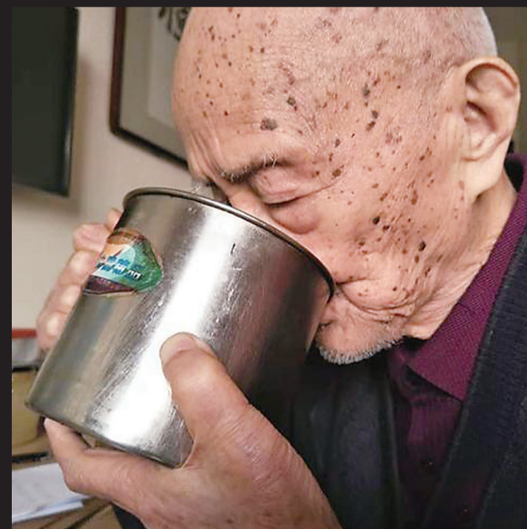
一个不锈钢水杯就是老人简朴一生的写照。