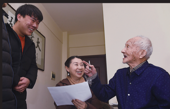
和学生们亲切交流。