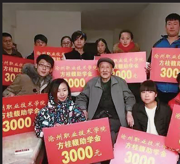
老人生前资助了很多学生。