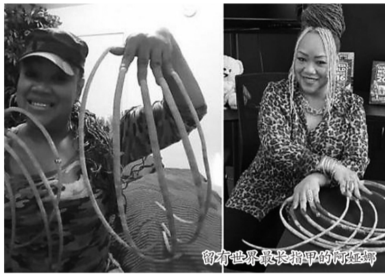
留有世界最长指甲的阿娅娜

据报道,有着世界上最长指甲的女子正在以3.5万英镑(约30.9万元人民币)的价格将指甲出售。