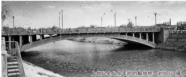
上世纪七八十年代的解放桥

老桥拆除的时候,很多沧州人都依依不舍地去河边相送。刘绍行说:“老桥拆除的时候,很多沧州人都觉得不舍。”张耀华说:“当时还有人说钢筋混凝土的桥身太低,以后可怎么过船呢。”可是,谁能想到短短几十年,航空、铁路等运输方式高速发展,年轻人都不知道沧州漕运曾经的辉煌了。